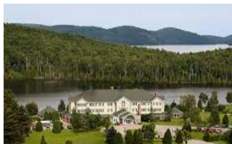
AUBERGE LAC A L'EAU CLAIRE ***sup