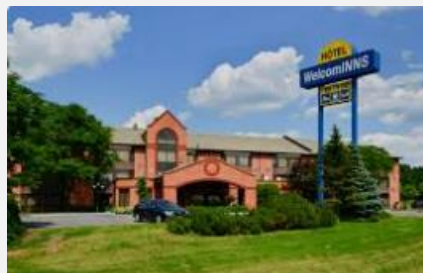
WELCOMINNS BOUCHERVILLE ***