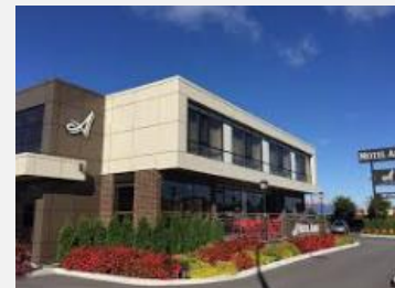
MOTEL ADAM GATINEAU ***