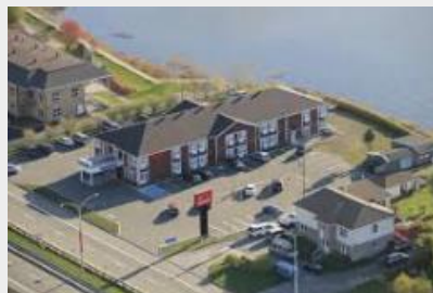
SLEEP INN QUEBEC EST ***