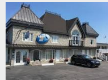
MOTEL VUE BELVEDERE