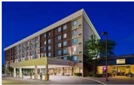
BEST WESTERN PLUS TORONTO AIRPORT ***